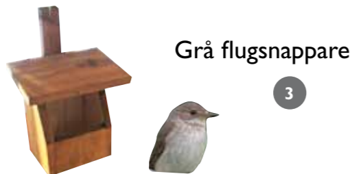
Grå flugsnappare 3